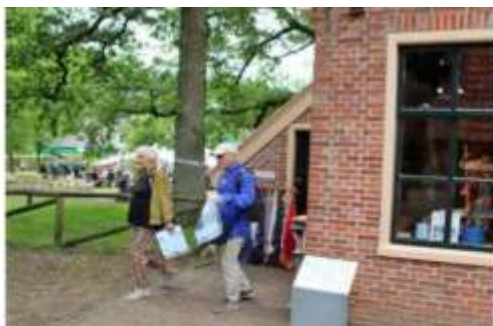
OPENLUCHTMUSEUM -- ARNHEM