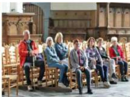
GROOTE KERK -- MAASSLUIS