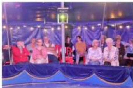
CIRCUS ALEXANDER / CIRCUS IN DE ZORG