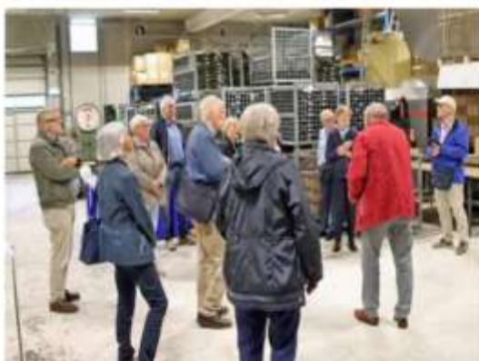
VRIJHEIDSMUSEUM -- GROESBEEK