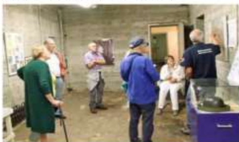
MUSEUM BESCHERMING BEVOLKING - RIJSWIJK