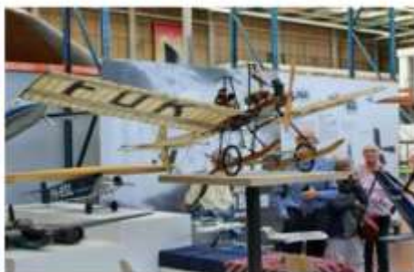
TRANSPORTMUSEUM -- NIEUW VENNEP