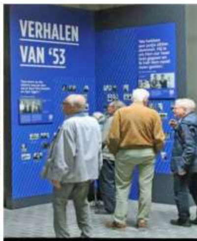
WATERSNOODMUSEUM -- OUWERKERK