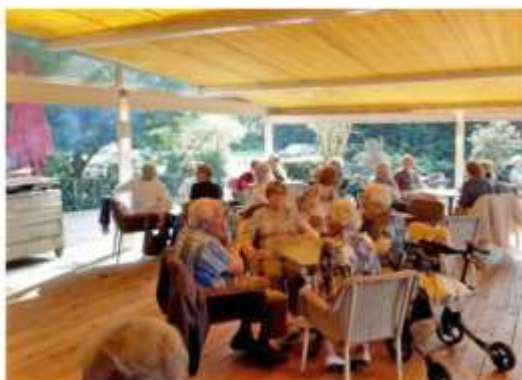
BARBECUE BIJ PARTYCENTRUM 'ONDER ONS'