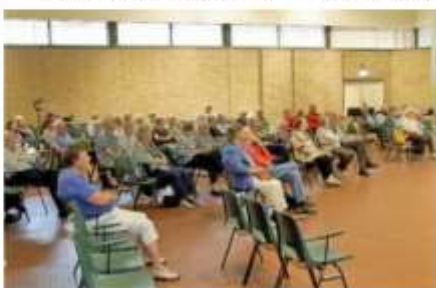
LEZING 'HERKENNEN VAN VOGELS' - VIERHOVENKERK