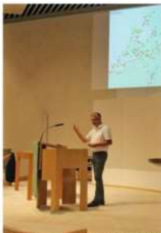
LEZING 'JONKVROU RICARDE' MOZAIEKEN -- VIERHOVENKERK STICHTERES VAN DELFT