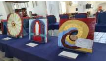
Catharinakerk – Iconen