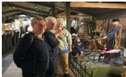
Museumboerderij De Weistaar